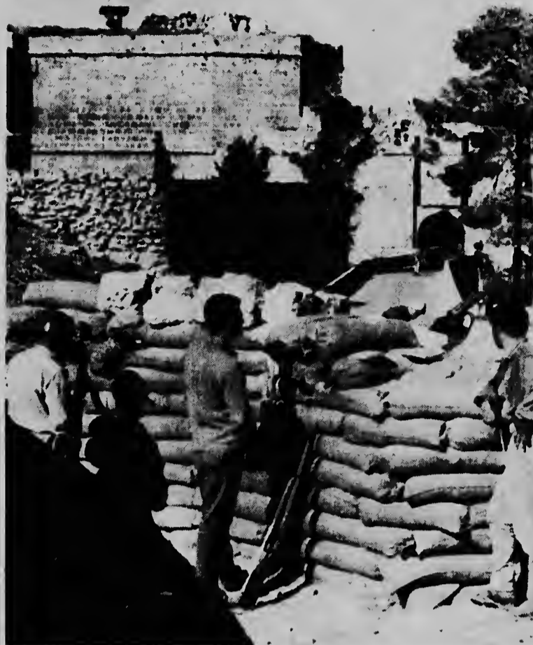
FAMAGUSTA, Cyprus - Un miembro di Guardia Nacional Chipriota ta loer riba sacu di santu den direccion di e muraya di Famagusta caminda Chipriotanan Turco a sconde nan mes, despues di peleanan callejera den cual algun Chipriote Turco a muri. Tropanan di Nacionnan Uni ta patrullando den e region awor aki.

Aunque nominalmente e mensaje ta ser pronuncia na nomber di e soberana, redaccion ta corre na cargo di e partido cu na e momento ey ta na poder.